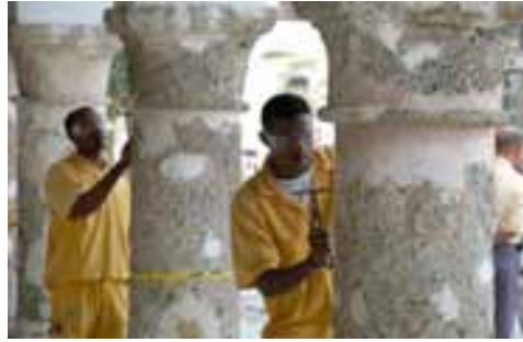
Taller de Forja y Fundición. Escuela Taller Santa Cruz de Mompox Taller de Cantería. Escuela Taller Cartagena de Indias