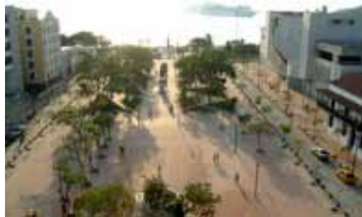
Plaza de Bolívar, Santa Marta, Magdalena