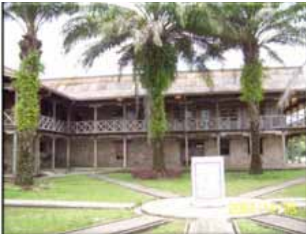
Casa Arana – La Chorrera, Amazonas

Un bien o una manifestación pueden cumplir todos o algunos de los criterios establecidos, pero el ámbito de la declaratoria o de la inclusión en la LRPCI, es decir, si es nacional o territorial (departamental, distrital, municipal o de territorios indígenas y comunidades negras, según lo especifica la Ley 70 de 1993), depende de su representatividad e importancia dentro del ámbito al que pertenece.