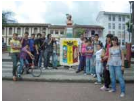
CMM Sevilla (Valle del Cauca)