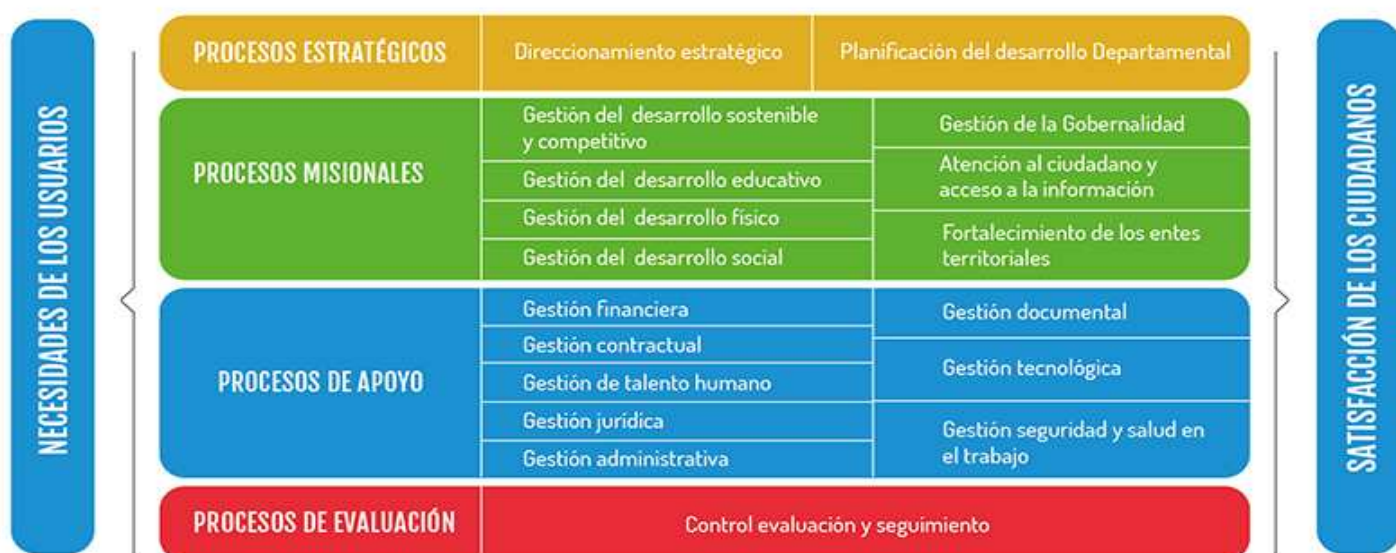
MAPA DE PROCESOS DE GESTIÓN